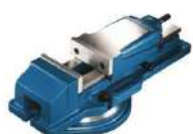
Morsa mecânica hidráulica giratória