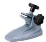
Suporte para micrômetro externo