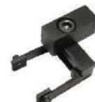
Puxador de barras