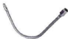
Flexível de aço