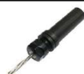
Suporte flutuante para alargador