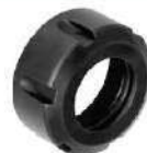
Porcas para pinças