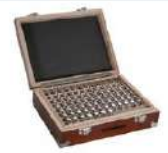
Jogo de pinos alibradores