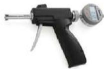
Micrômetro interno tipo pistola