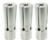
Pinças tipo kojex