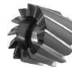
Fresas de chaveta