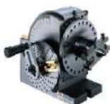
Divisor universal semi universal