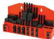
Kit com presilhas de fixação