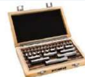
Jogo de blocos padrão em aço