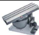
Mesa de seno