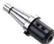
Cone weldon ISO