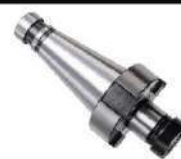
Cone porta fresa ISO