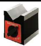
Bloco em V magnético