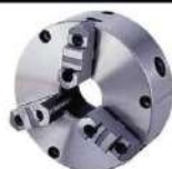
Placa para torno