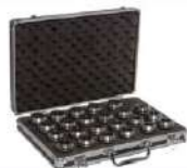
Jogo de pinça