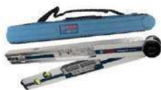
Régua para digital