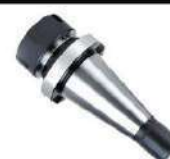
Cone porta pinças ISO