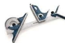
Esquadro combinado completo