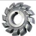
Fresas de perfil constante