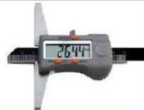
Paquímetro digital de profundidade