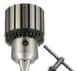
Mandril com chave