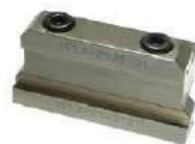
Bloco para Lamina